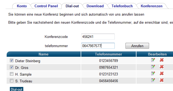
Beginnen einer neuen Konferenz mit dem Control Panel

Mit Dial-out können Sie auch eine neue Konferenz starten, wenn Sie als Vorsitzender eingeloggt sind. Hierfür geben Sie den Konferenzcode und Ihre Telefonnummer im "Dial-out" Fenster ein.